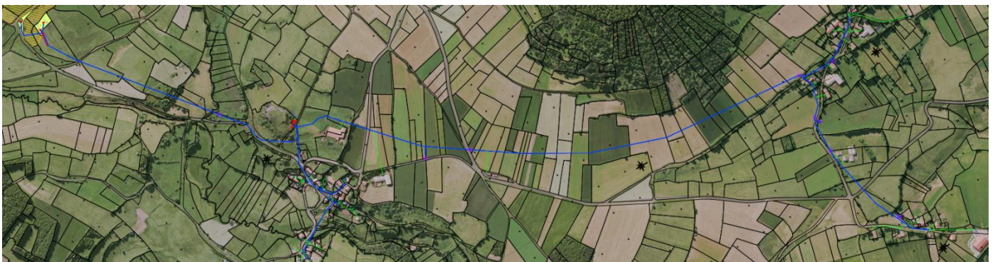
La Villette-Fourmagne – Le Chaussadis