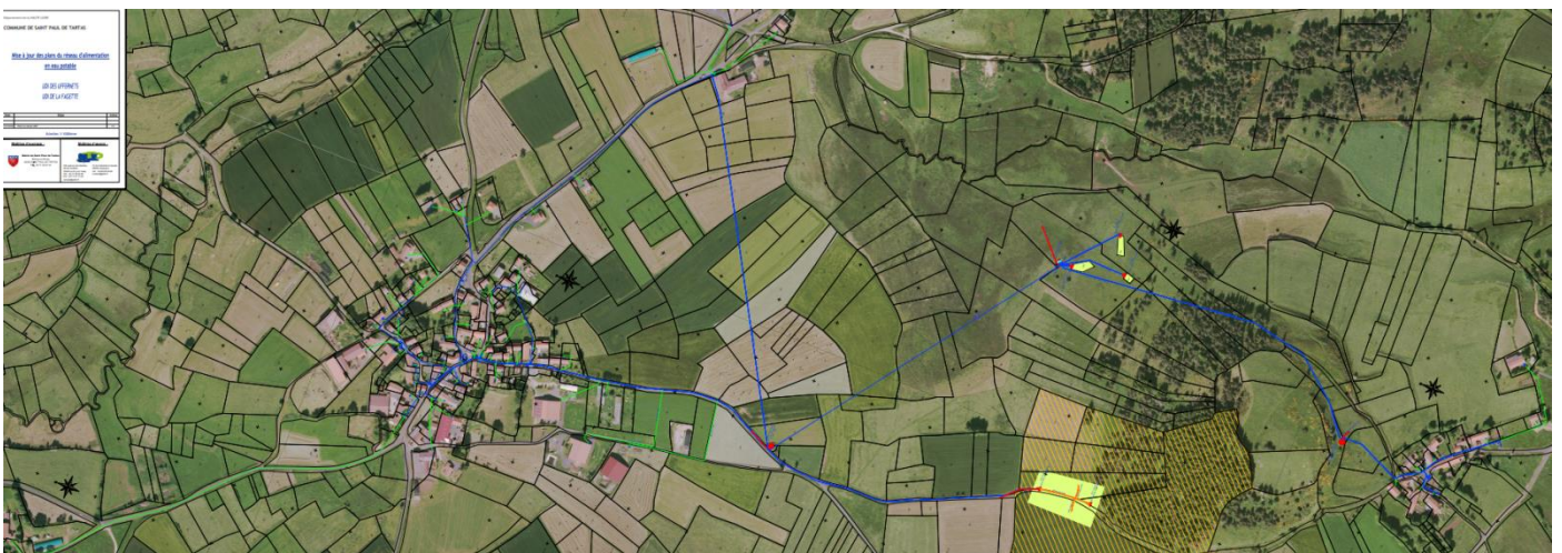
Les Uffernets – La Fagette